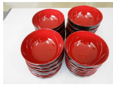
汁椀 62 客