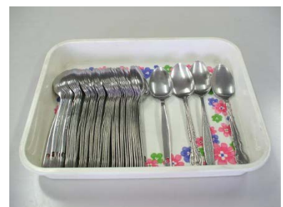
スプーン 44 本