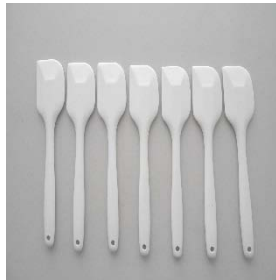
ウイズシリコンゴムベラ7本