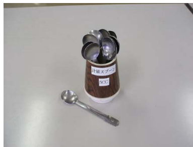
5cc 7 個