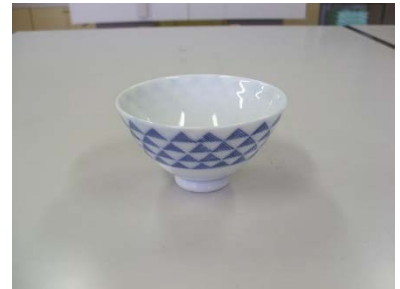
飯茶碗 (うろこ紋) 4 客