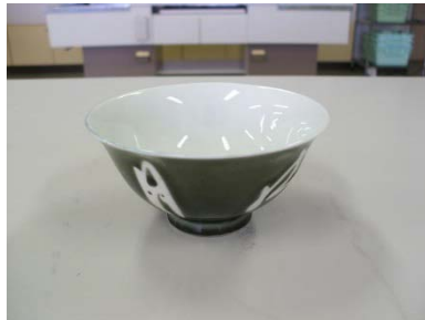
飯茶碗 (緑) 5 客