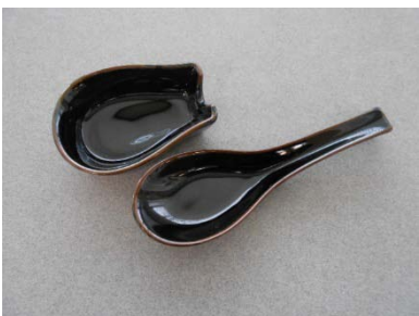
れんげ 25個・れんげ台 25個