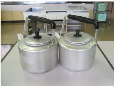
アルミやかん 26cm 2 個