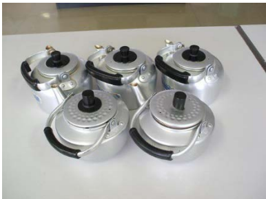
アルミ急須 4 個 新品 3 個