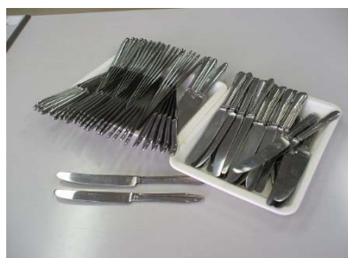
ナイフ 78 本