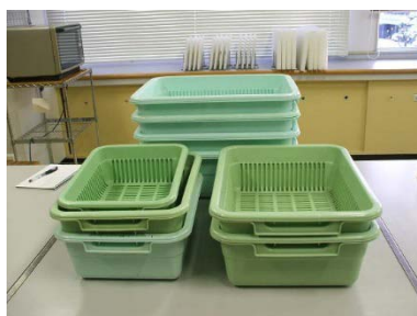
洗いかご 小1個・中1個 大2個・特大4個