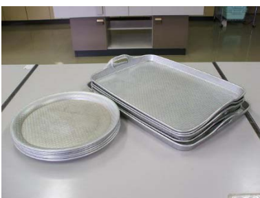
アルミ盆 丸 (32cm) 2枚 角 (48×33cm) 4枚 (52×37cm) 1枚