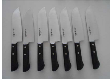
万能包丁 16cm 7丁