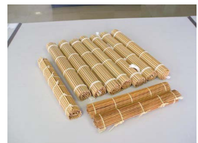
巻きす 大 6 枚 中 2 枚 小 2 枚