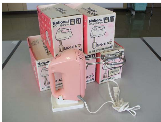
ハンドミキサー 6台