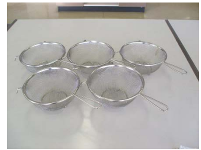
手つきステンレスざる