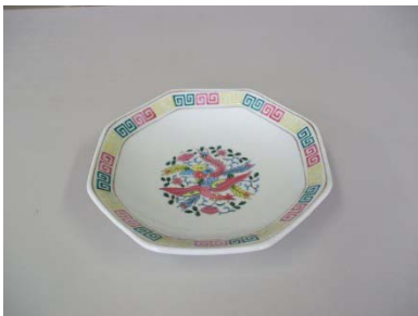
八角皿 18cm 24枚