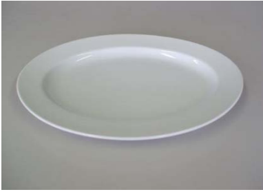
楕円大皿 36×27cm 10枚