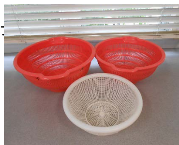
プラスチックざる

30cm 緑 1個 ベージュ 1個 23cm 緑 3個 オレンジ 2個 18cm 緑 2個 オレンジ 2個 ベージュ 1個