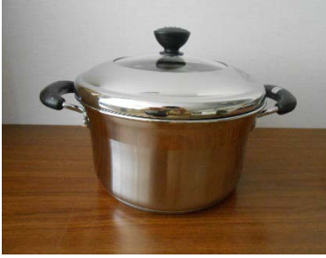
ガラス蓋付ステンレス両手鍋 24cm 7 個