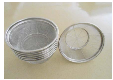
エコノミーざる 25cm 7個