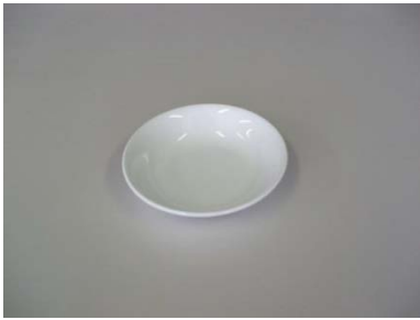
小皿（白無地深型）14cm 44 枚