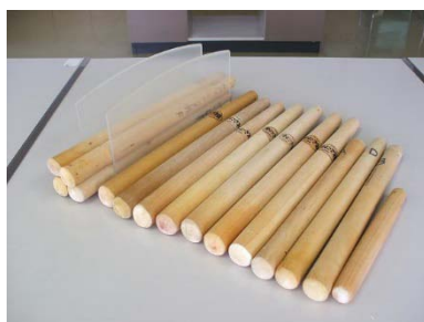
すりこぎ棒 大 11 本 中 3 本 小 2 本