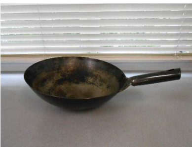
片手中華鍋 33cm 1個