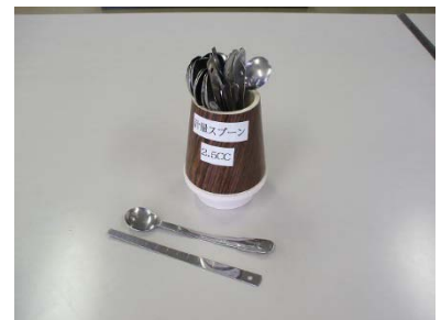
2.5cc 7 個 すりきり 5 本