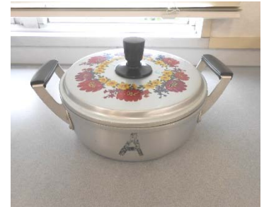
アルミ浅型両手鍋 22cm 1個