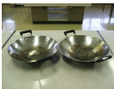
両手中華鍋 33cm 2個