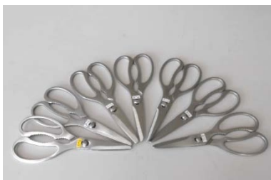
キッチンはさみ 7丁