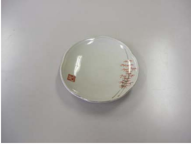
小皿 竹柄 12cm 14 枚