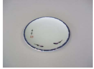
丸皿 (茄子) 19.5cm 52 枚