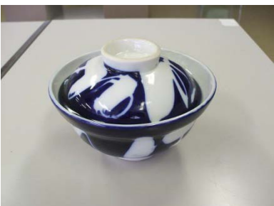
ふた付きどんぶり 9 客