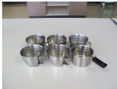
200cc 計量カップ 6 個