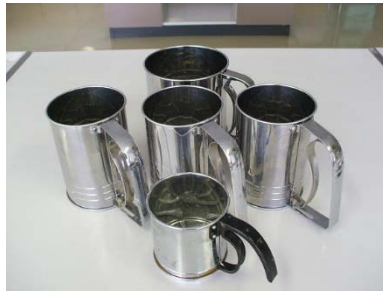
粉ふるい 大1個 中3個 小1個