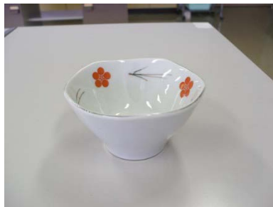
小鉢 11cm 32 客