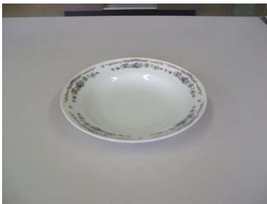
スープ皿 23cm 2枚 枚