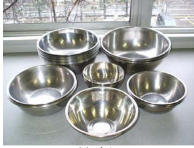
ステンレス製ボウル

27cm 3個 24cm 9個 21cm 3個 19cm 1個 18cm 5個 14cm 3個