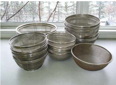
ステンレス製ざる