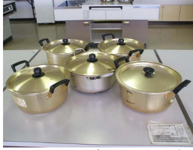
アルマイト両手鍋 24cm 4個 浅型両手鍋 24cm 3個