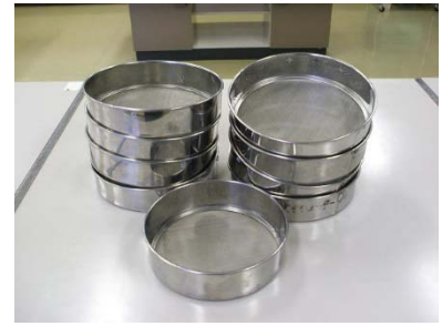
万能こし器 大(22cm) 8個 小(18cm) 1個