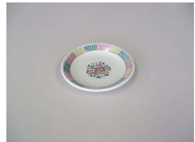
小皿 13.5cm 22枚