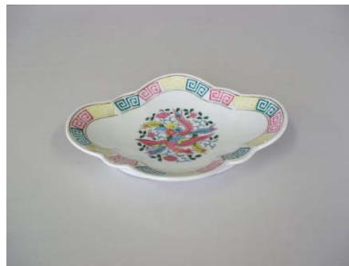
中華皿 21×15.5cm 22枚