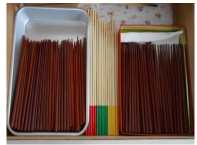
箸 87本 菜箸大7本・中3本