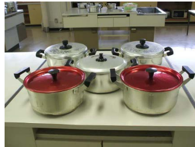
アルミ両手鍋 24cm 2個 浅型両手鍋 24cm 4個