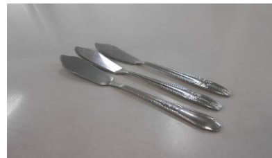
バターナイフ 3 本