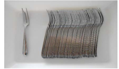
ヒメフォーク 50 本