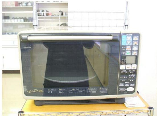
オーブンレンジ 東芝 900V 2台