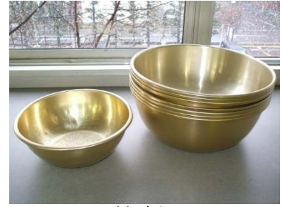
アルマイト製ボウル

27cm 3個 24cm 9個 21cm 3個 19cm 1個 18cm 5個 14cm 3個