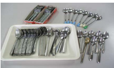
ティースプーン 83 本