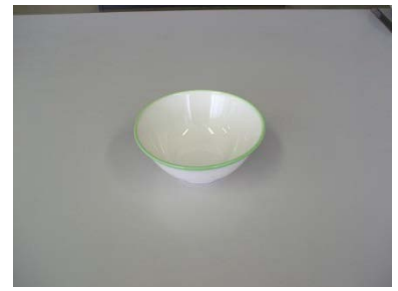
ボウル（白×緑）14cm 29 客