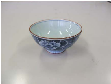
飯茶碗 (牡丹) 21 客