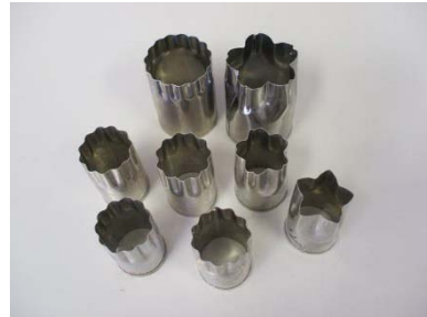
抜き型 大2個 小6個