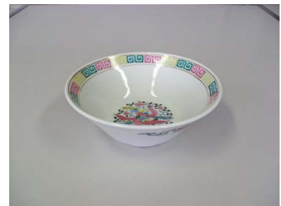
どんぶり 19cm 23客