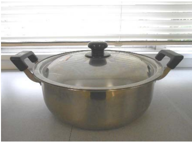
ステンレス両手鍋 30cm 1個