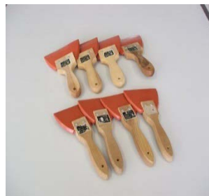
シリコンゴムベラ8本