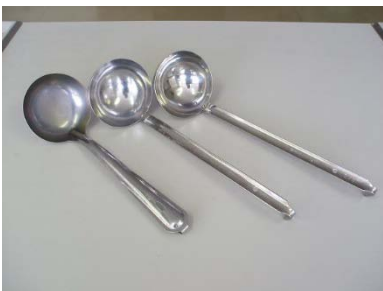
ステンレスおたま（大） 6個