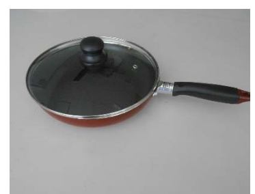
ガラス蓋付フライパン テフロン 26cm 7個