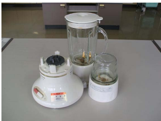
ジュースミキサー 6台 ※ミルカップのパーツは5個のみ