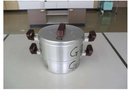
アルミ丸型蒸し器 22cm 1 個