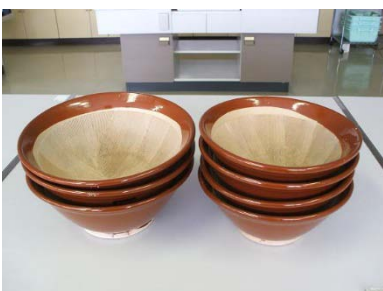
すり鉢 大 3 個 小 4 個