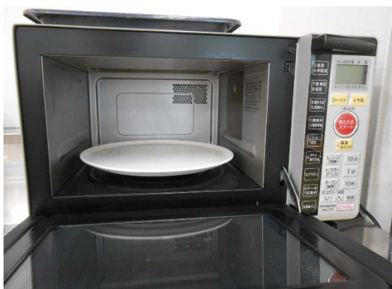
オーブンレンジ 日立 950V 1台