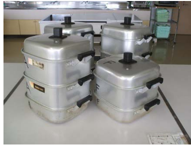
アルミ角型蒸し器 24cm3 段 3 個 2 段 1 個