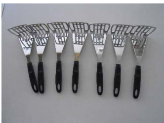
ポテトマッシャー 7本