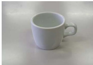
カップ 13 客