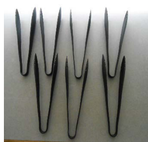
ナイロントング 7個