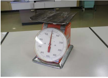
1kg はかり（最小目盛 2g） 2 台