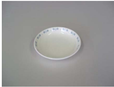
小皿（花柄深型）13.5cm 31 枚