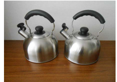
ステンレス笛吹ケトル 2.4ℓ 2 個