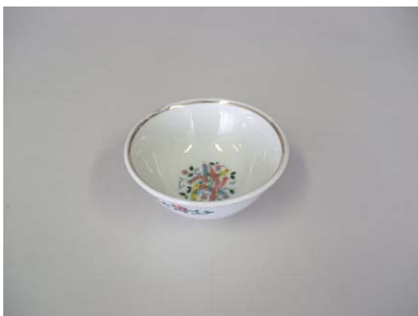
小鉢 11.5cm 10客