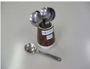
15cc 7 個