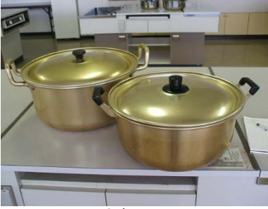
アルマイト大鍋 39cm 36cm 各1個