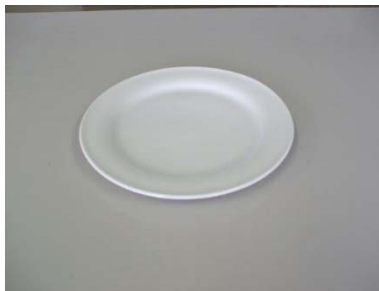
中皿 23cm 49枚