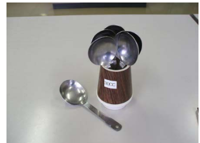
計量スプーン 30cc 7 個