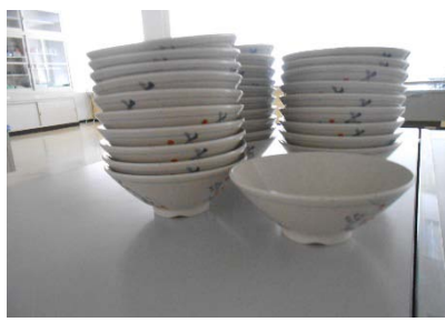
飯椀 マリ製 30 個