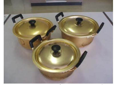
アルマイト両手鍋 20cm 2個 18cm 1個