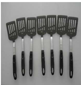
ナイロンターナー7個