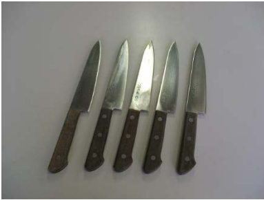
万能包丁（藤次郎）5丁