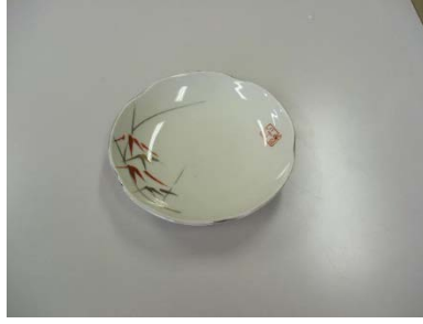
小皿 笹の葉柄 12cm 17 枚