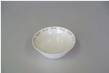
小鉢（花柄）13cm 36 客