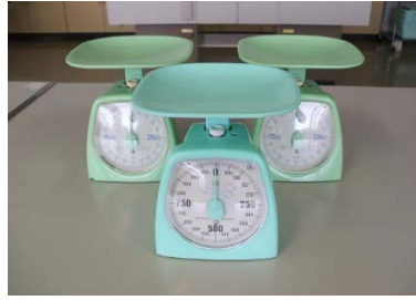
1kg はかり（最小目盛 5g） 3 台