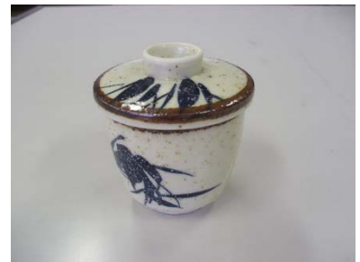
ふた付き茶碗蒸し 10 客