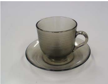
カップ&ソーサー カップ 22 個 ソーサー 27 個