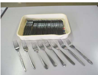
フォーク 95 本