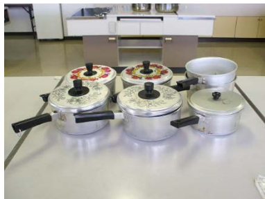
アルミ片手鍋 20cm 5個 18cm 1個