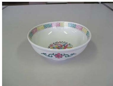
どんぶり 19cm 17客