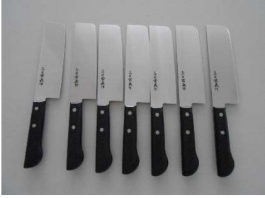
菜切包丁 16cm 7丁