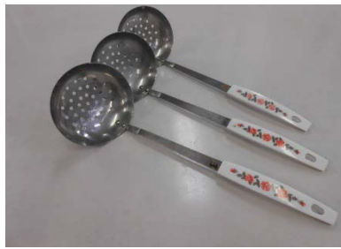
穴杓子 スレンレス 3個