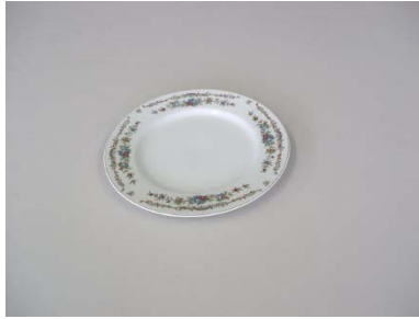
中ケーキ皿 19.5cm 35枚