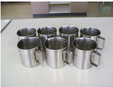
500cc 計量カップ 7 個