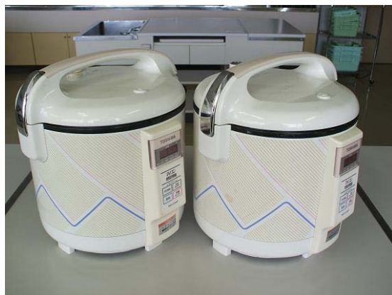
マイコン炊飯ジャー（1.5升炊き）1000W