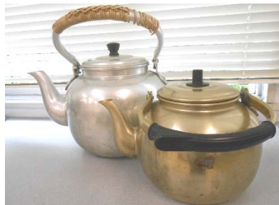
アルマイトやかん 15・8L 各 1 個