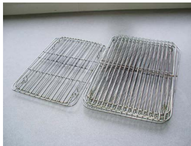
油切り網 28×20cm 6枚 25×18cm 2枚

29×23cm2枚 30×21cm3枚 27×19cm5枚 26×20cm1枚 21×15cm3枚 23×16cm1枚