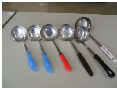
ステンレスおたま（小） 7個