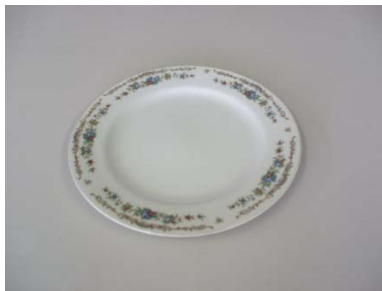
大皿 23.5cm 11枚