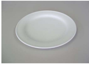
大皿 26cm 20枚