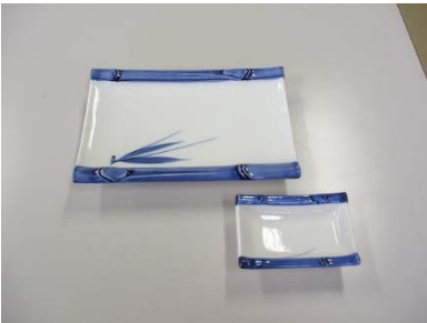
焼物皿 17×11.5cm 23 枚