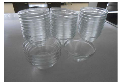
ボンベール ガラス 580ml 35 個