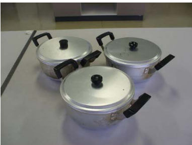
アルミ両手鍋 18cm 3個