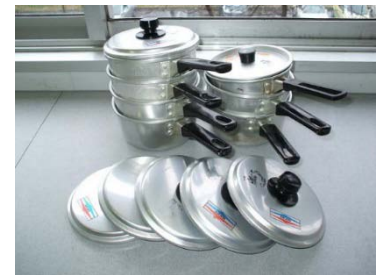
ミルクパン 14cm 6個