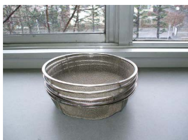
ステンレス製浅型ざる