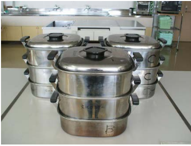
ステンレス 3 段角型蒸し器 29cm 3 個