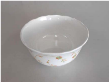
小鉢 メラミン製 50個