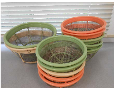
ステンレス製ざる

30cm 緑 1個 ベージュ 1個 23cm 緑 3個 オレンジ 2個 18cm 緑 2個 オレンジ 2個 ベージュ 1個