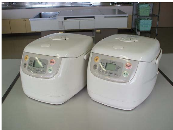
IH 炊飯ジャー（1升炊き）2台 1300W